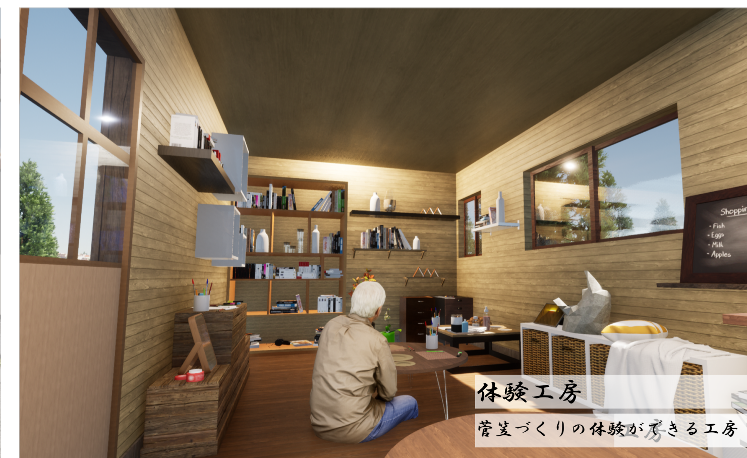
体験工房 菅笠づくりの体験が楽しめる工房