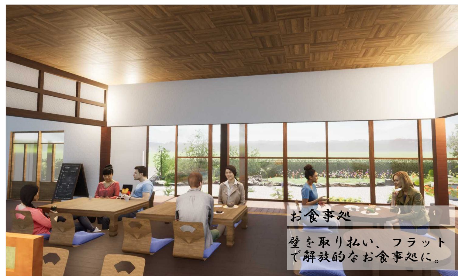
お食事処 壁を取り払い、フラットで解放的なお食事処に。

お食事処や直売所には観光客だけでなく、地域の高齢者も多く利用する。 地域の高齢者の交流の場 として活用されるだけでなく、 地域内外の世代間交流の場 としての活用も期待できる。