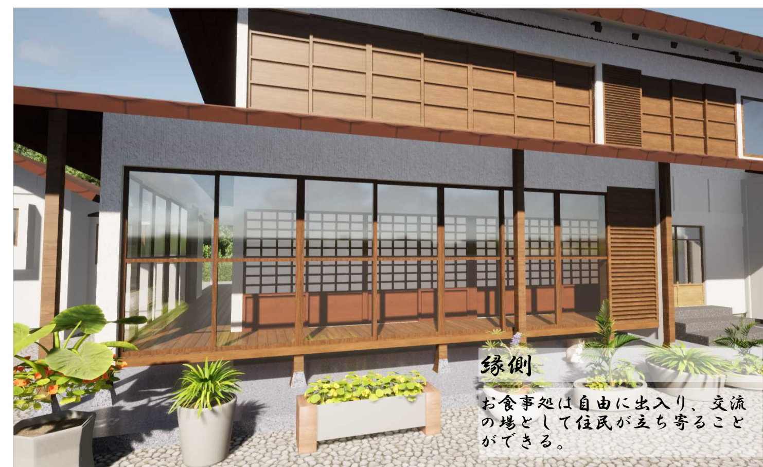
縁側 お食事処は自由に入出入り、交流の場として住民が立ち寄りができる。